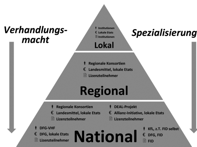
Abb. 1: Beschaffungsebenen für die Lizenzierung elektronischer Medien in Deutschland

Alle drei Beschaffungsebenen sind heute voll entwickelt und parallel aktiv. Es handelt sich um ein komplexes dreischichtiges Gefüge, das in der Staffelung lokal – regional – national eine zunehmende Steigerung in der Anzahl der